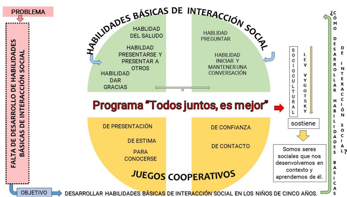
Figura 2: Características del programa juegos cooperativos todos juntos es mejor

El programa todos juntos es mejor, (Véase en anexo N° 1) ha sido diseñado para niños y niñas de cinco años de edad, el cuál nace ante la necesidad de desarrollar habilidades básicas de interacción social en niños y niñas de cinco años de edad, mediante los juegos cooperativos, por lo que se sustenta en la teoría sociocultural, planteada por Lev Vygotsky, quien sostiene que somos seres sociales que nos desenvolvemos en contexto y aprendemos de él. Dicha teoría se refleja en las actividades lúdica planteadas en el programa, porque el niño para lograr desarrollar habilidades básicas de interacción social, está en constante intercambio y en