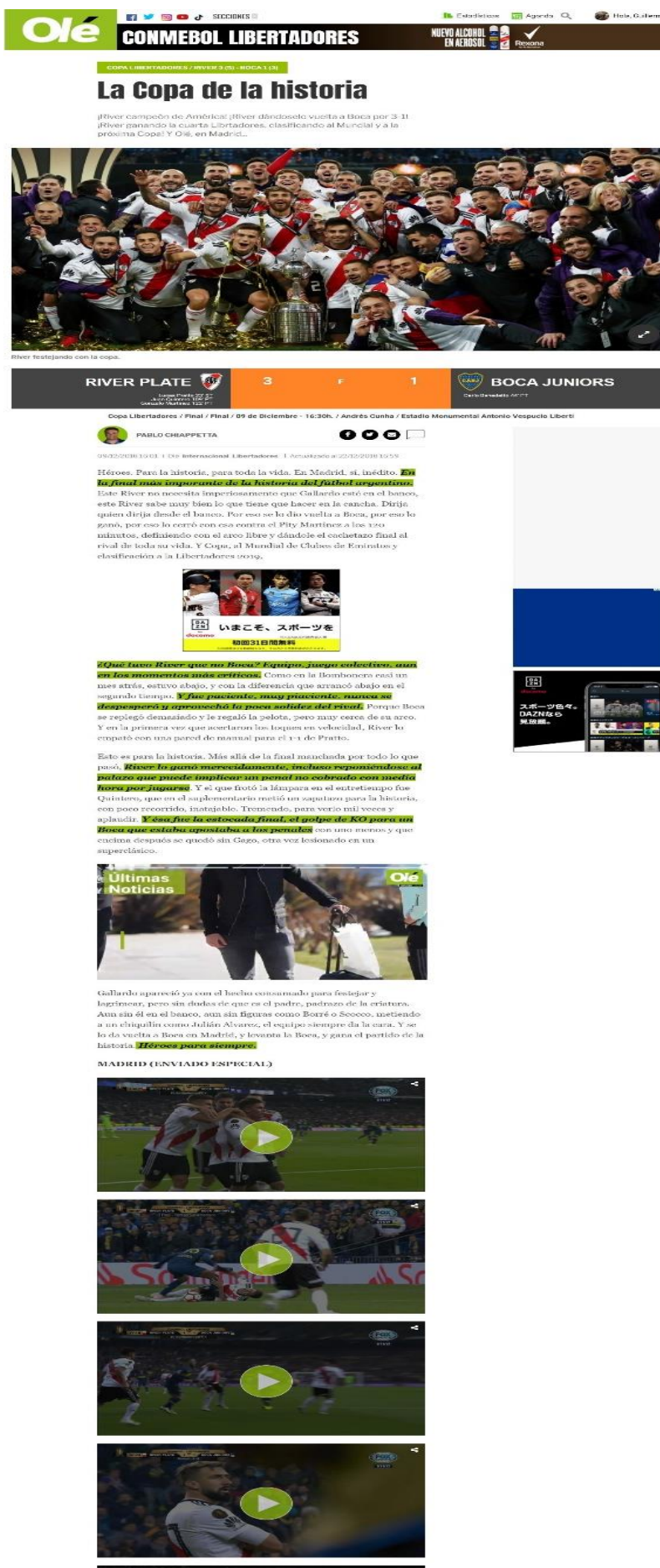
Noticia: La Copa de la historia (pt.1)