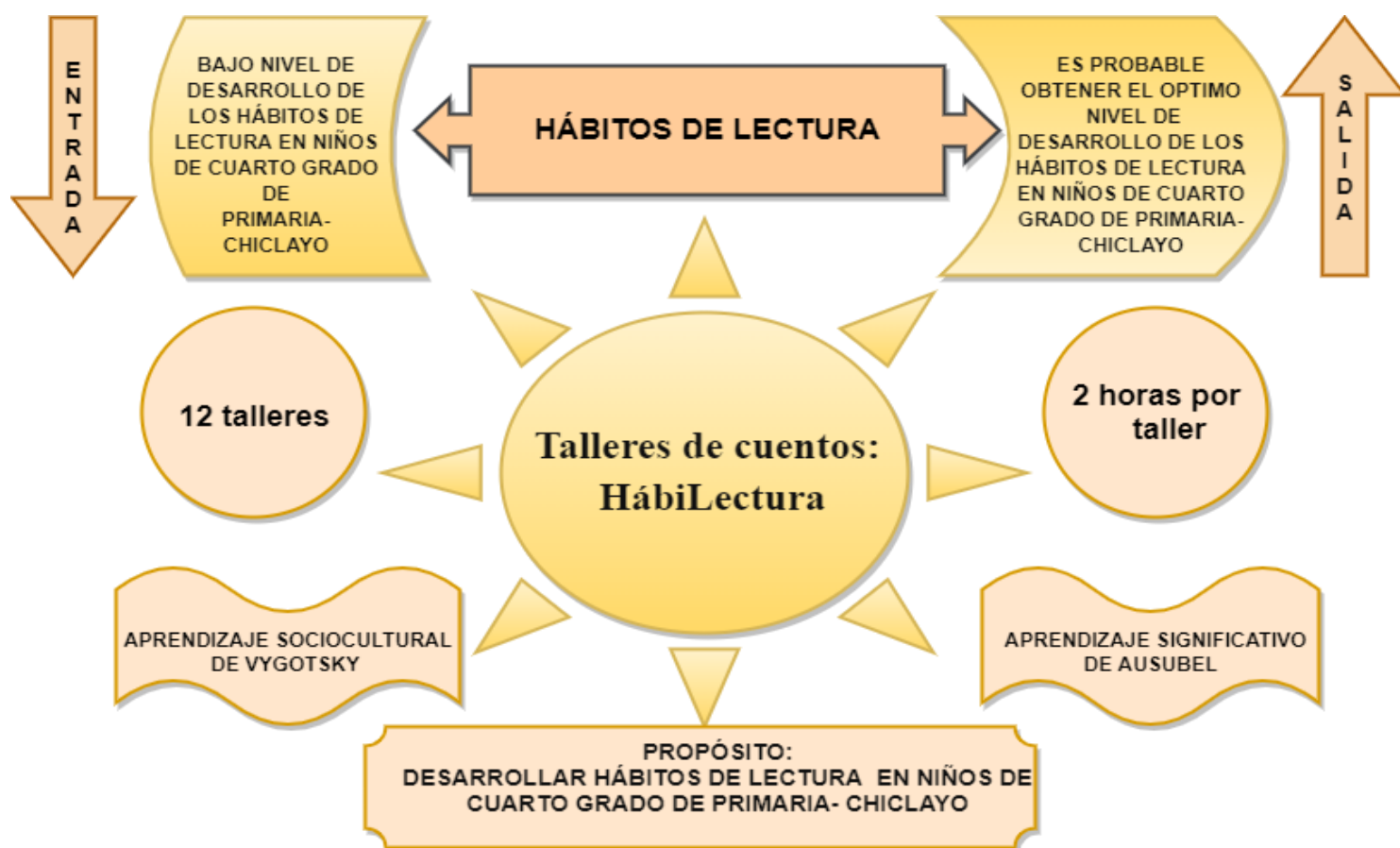
Figura 2. Determinar las características de los talleres de cuentos orientados a fomentar el hábito de la lectura en estudiantes de cuarto grado de primaria de una institución educativa Chiclayo, 2021.

A continuación, se adjunta el modelo teórico: