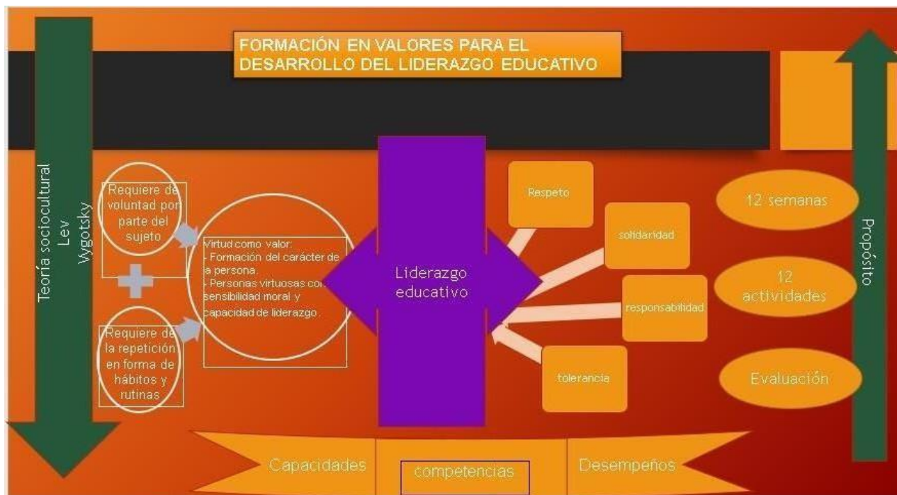
Figura 3. Modelo teórico de la propuesta. Autoría propia

En cuanto a la preparación del proceso de la propuesta académica sobre el programa Formación en valores para el desarrollo del liderazgo educativo en los estudiantes de educación primaria se consideró la elaboración de un modelo teórico donde explica y describe los lineamientos del programa para su ejecución y aplicación teniendo en cuenta como fundamento su base teórica, metodología y estrategias para lograr con los objetivos planteados.